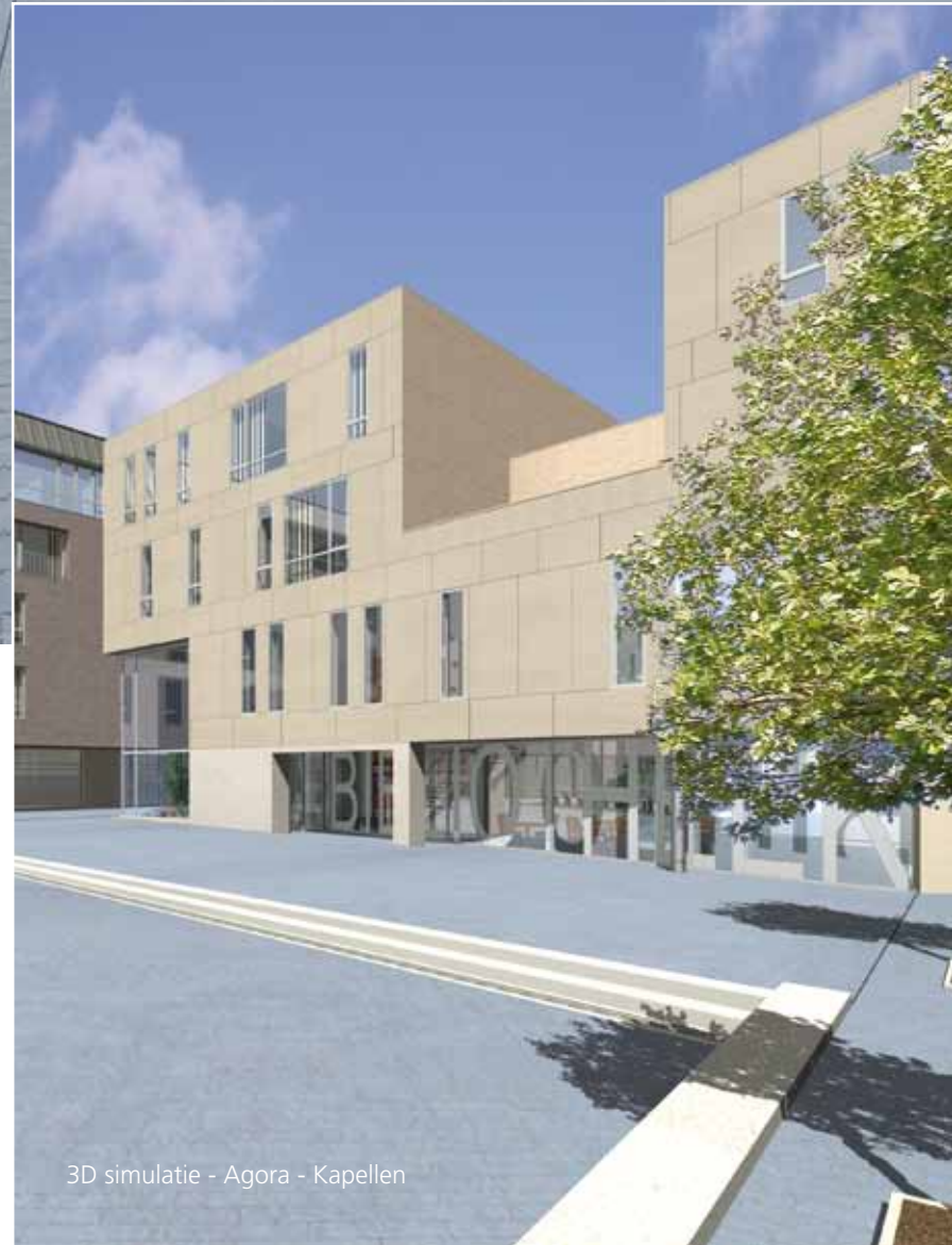
3D simulatie - Agora - Kapellen