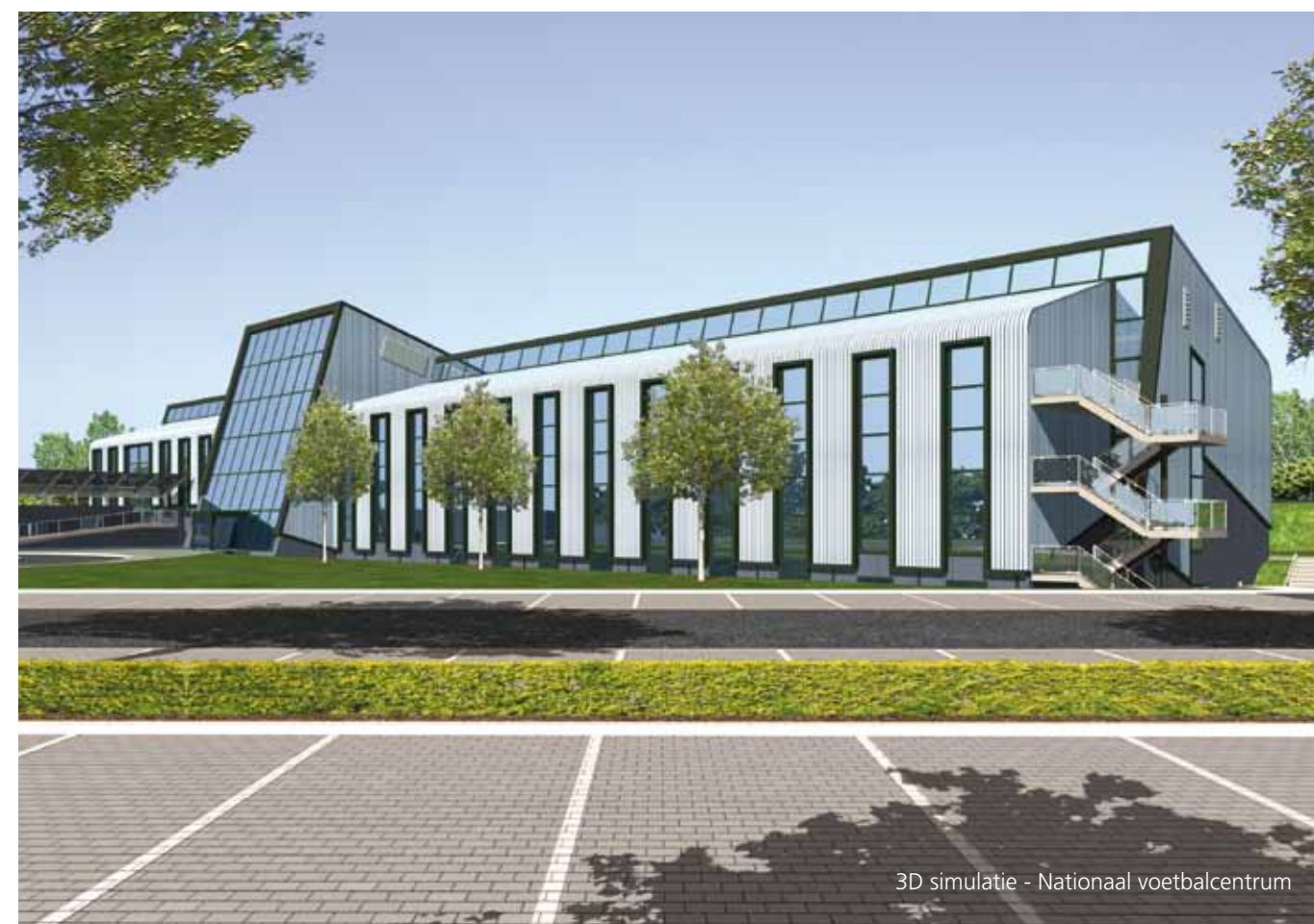
3D simulatie - Nationaal voetbalcentrum