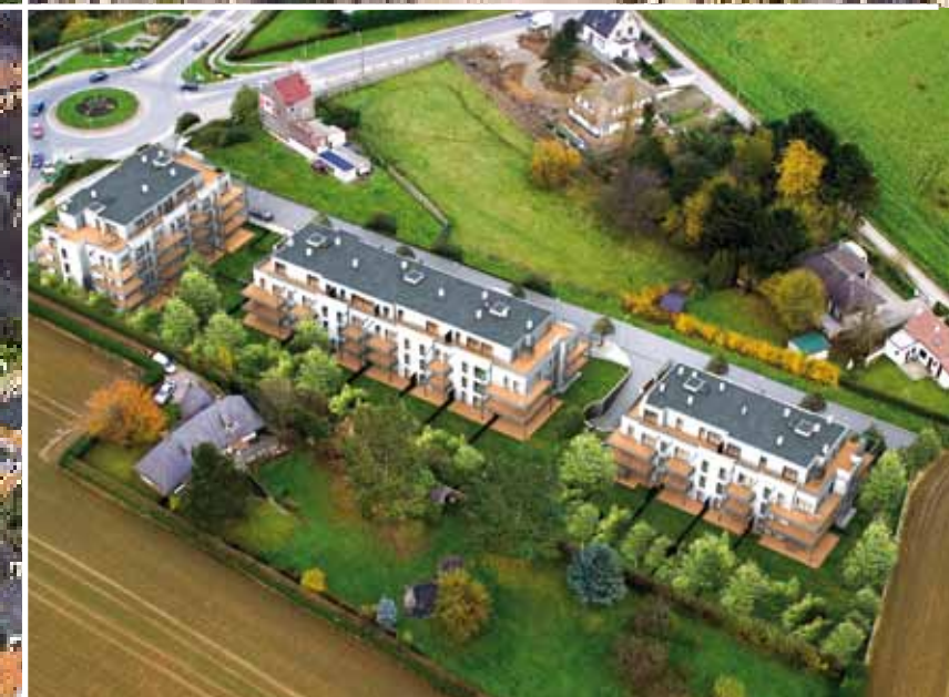
3D simulaties projecten: Concept plus NV - Promobuild NV - Bouygues Immobilier SA